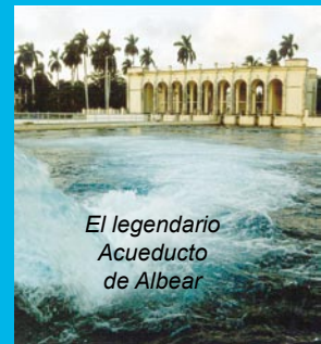
El legendario Acueducto de Albear