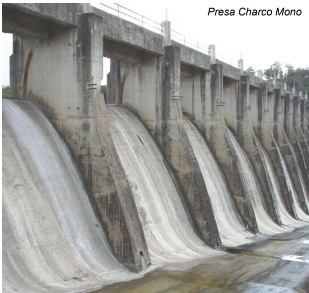
Presa Charco Mono