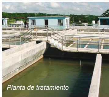
Planta de tratamiento

► Por supuesto que no las sabe porque aún no han sido escogida. Consta que la Unión de Arquitectos e Ingenieros de la Construcción (UNAICC) de Ciudad de La Habana realizó una encuesta con muchos prestigiosos hidráulicos de la Capital, para establecer un listado que se sometería después a consenso con los profesionales de la Hidráulica del resto del país, cuyos resultados ¿quedaron olvidados en una gaveta?