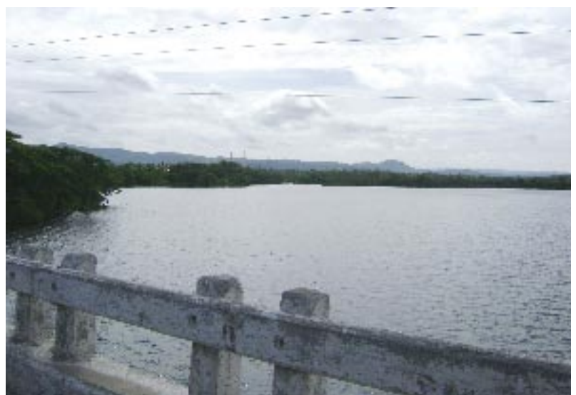
Presa "Carlos Manuel de Céspedes", en la provincia de Santiago de Cuba.